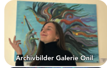
Archivbilder Galerie Onil

+++ So. 24.08.: Tanztee +++ Fr. 29.08.: Open Air Kino +++ Fr. 19.09. bis So. 21.09.: Modern Acoustic Guitar Festival +++